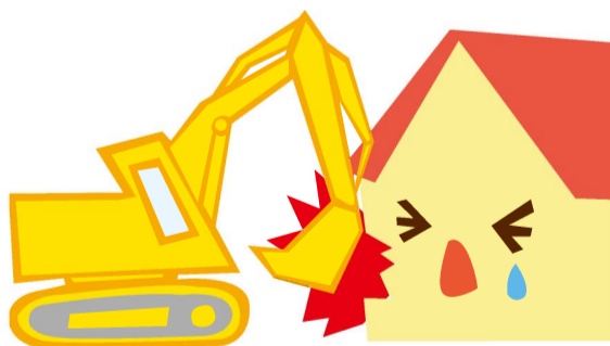
労働者、従業員の取扱上の過失または第三者の悪意によって生じた損害