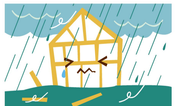
台風・高潮・豪雨・洪水によって生じた損害