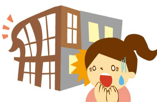
設計、施工、材質または製作の欠陥によって生じた損害（注）

（注）設計、施工、材質または製作の欠陥により崩壊・倒壊・破損等の不測かつ突発的な事故による損害が生じた場合のみ保険金をお支払いします。欠陥そのものを除去するための費用に対しては保険金をお支払いしません。