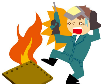
火災・爆発・破裂によって生じた損害